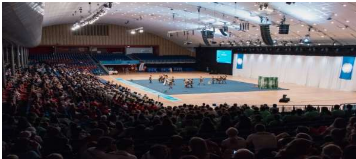
Concours, Vestfold 2017