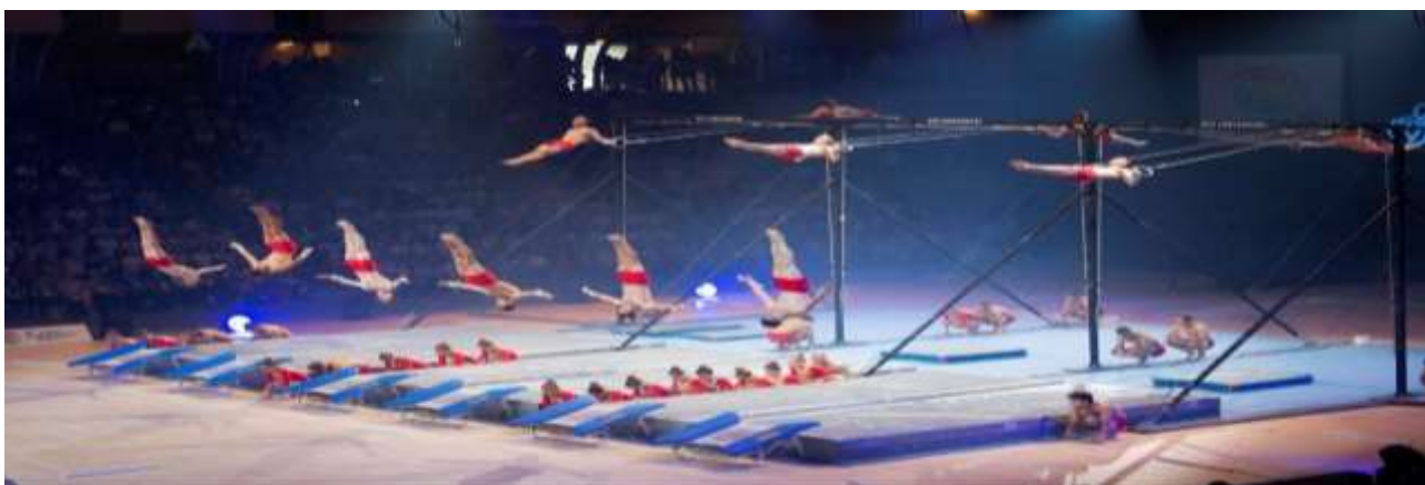
Performances Nationales, Dornbirn 2019

Ledit contrat doit être signé par les deux parties après confirmation reçue de la part de la FIG et du COL et avant le délai d'inscription provisoire.