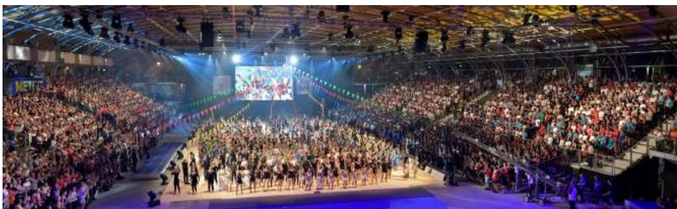
Gala FIG, Dornbirn 2019