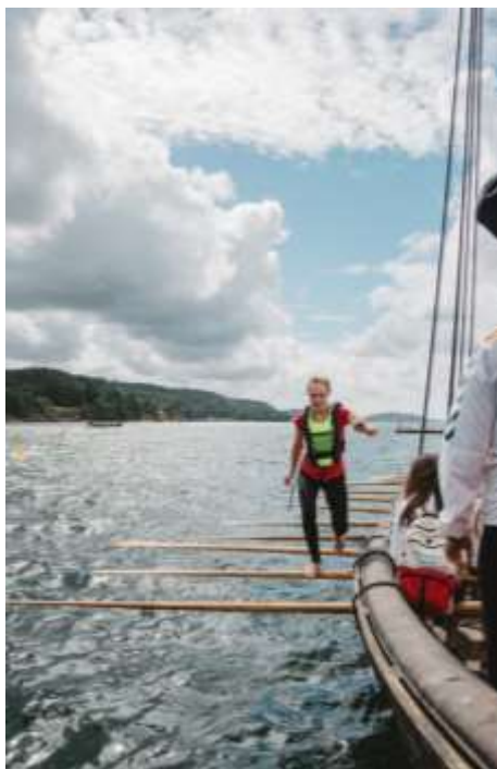
Manifestations accessoires, Vestfold 2017

Le coût de ces activités n’est pas inclus dans la carte de participants.