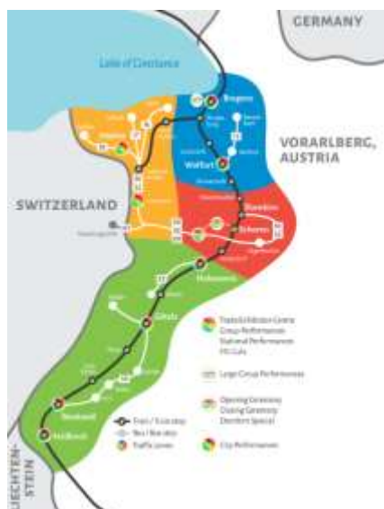
Carte des zones de transports, Dornbirn 2019