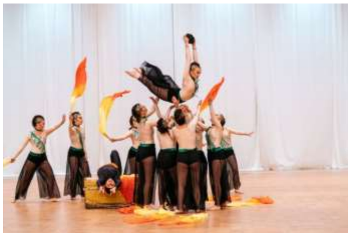
Concours, Vestfold 2017

Nommé par le COL, le chorégraphe du gala définit l'ordre de départ des groupes en lice. Le chorégraphe est également responsable de la répétition générale du gala. La répétition générale est obligatoire pour les 16 groupes.