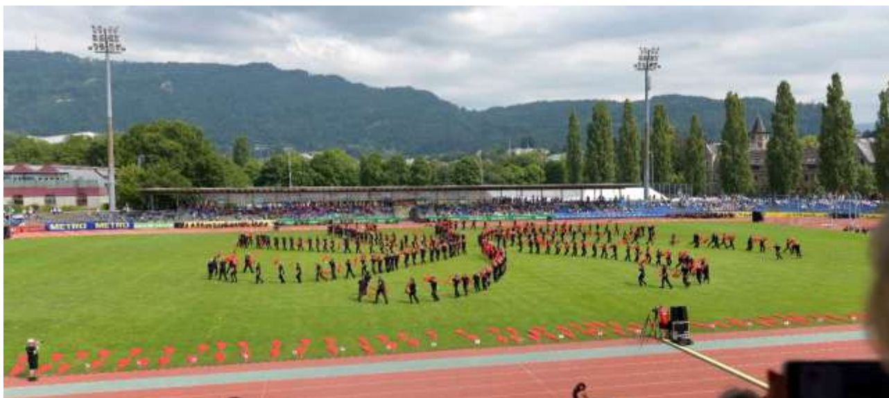
Production en grands groupes, Dornbirn 2019

Le même stade que la cérémonie d'ouverture peut être utilisé en fonction des infrastructures locales.