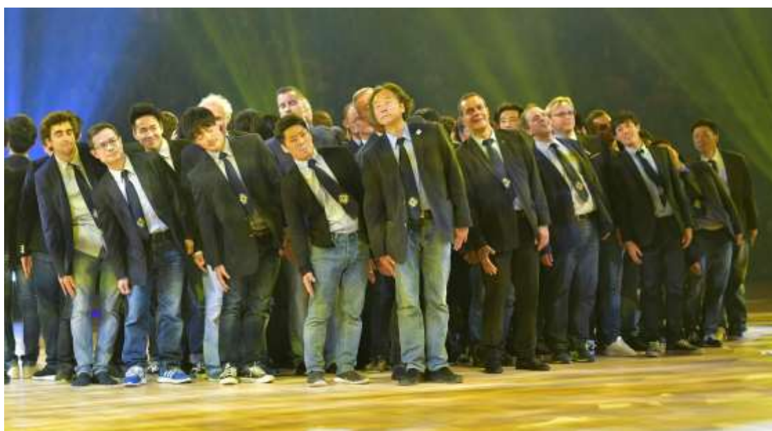
Gala FIG, Dornbirn 2019