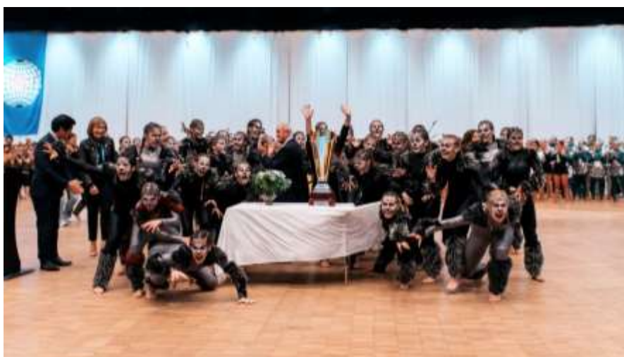
Gala, Vestfold 2017

Au moment de la proclamation du GROUPE CHAMPION DU MONDE, le drapeau national de ce dernier est hissé et son hymne national est joué.