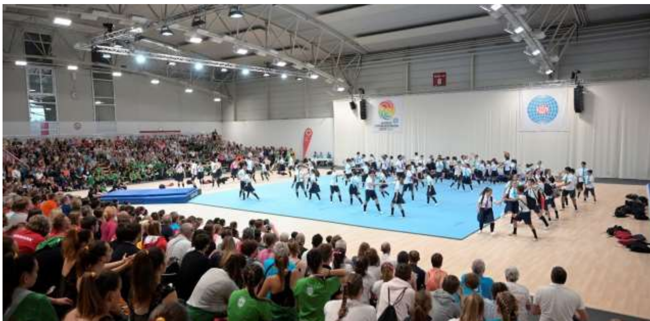
Production en groupes, Dornbirn 2019

Toutes les scènes doivent avoir un rideau de fond de scène et être équipées d'un sol adéquat pour la pratique de la gymnastique.