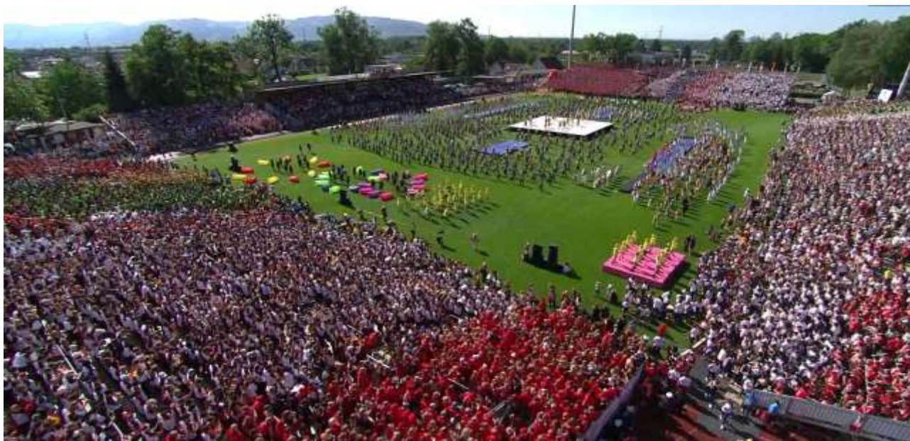
Cérémonie d'ouverture Dornbirn 2019

La cérémonie d'ouverture se déroule le premier jour de la Gymnaestrada Mondiale.