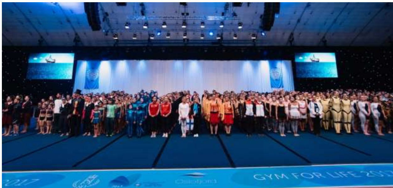
Concours, Vestfold 2017

Tous les gymnastes reçoivent soit une médaille d'or soit une médaille d'argent soit une médaille de bronze, et tous les groupes reçoivent un certificat