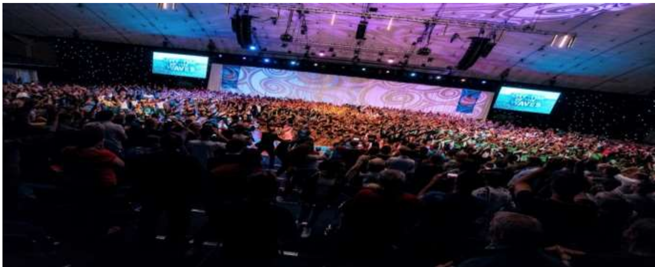
Cérémonie de clôture, Vestfold 2017

La cérémonie de clôture marque la fin d'une semaine festive et joyeuse. Tous les participants de toutes les fédérations participantes affiliées à la FIG doivent y prendre part.