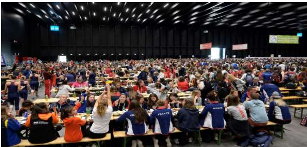
Réfectoire, Dornbirn 2019