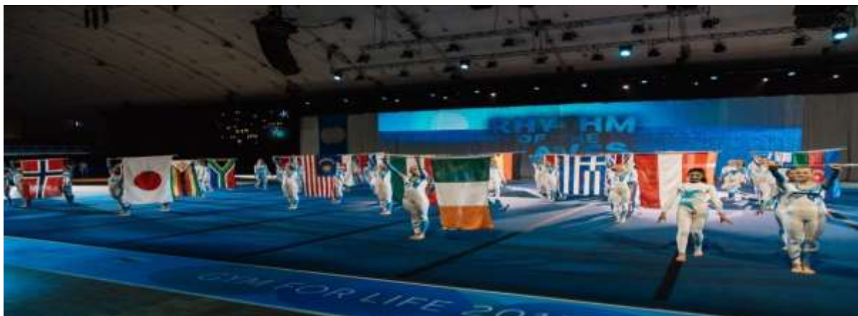
Cérémonie d'ouverture, Vestfold 2017

La cérémonie d'ouverture se déroule le premier jour du World Gym for Life Challenge