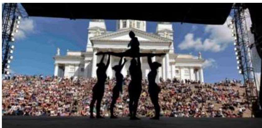
Performance en ville, Helsinki 2015

Ces activités peuvent être coordonnées directement par le COL ou confiées à un partenaire officiel. Le coût n'est pas inclus dans la carte de participation.